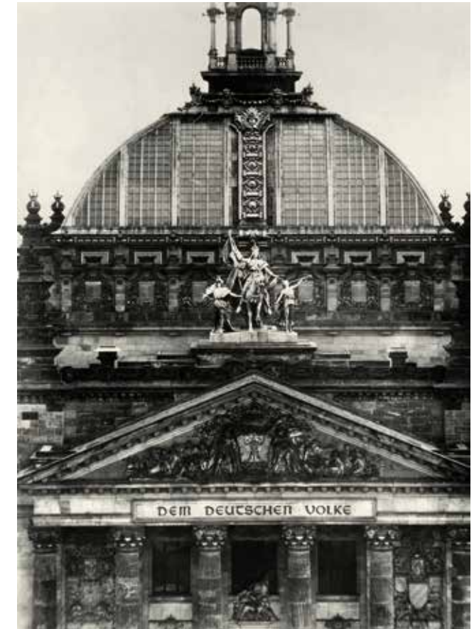
Der Reichstag in Berlin: Der 16 Meter breite Schriftzug „Dem deutschen Volke“ wurde erst 1916 im Weltkrieg angebracht und ist aus eingeschmolzenen Kanonen der Befreiungskriege gefertigt.

Es ist reizvoll, gedanklich eine Reise durch das Deutsche Reich zu machen, Holstes Recherchen weiter zu folgen und die über-