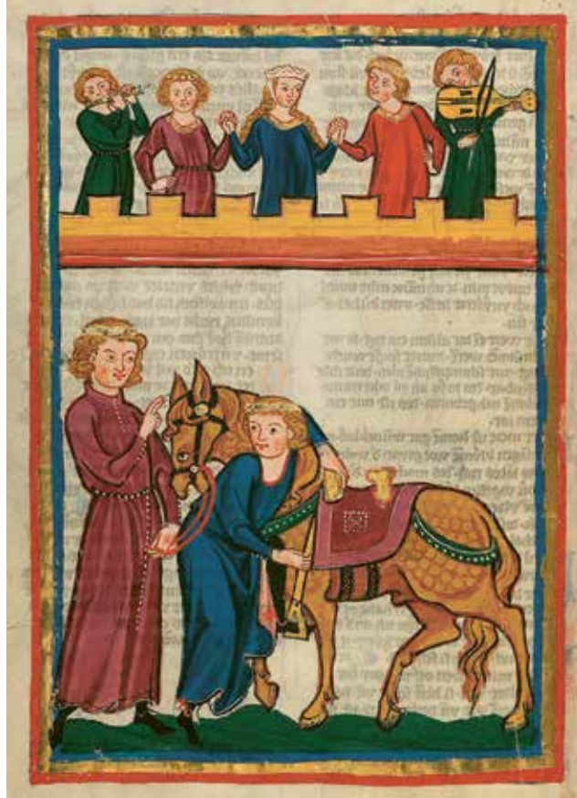
Ritter und Minnesänger zogen durchs Land und beflügelten die Phantasie. Hier der Dichter Meister Rumsland von Sachsen beim Besteigen seines Pferds.

Fußabdruck Jesu oder eine einbalsamierte Totgeburt, und machte Abstecher nach Bethlehem und zum Jordan, bis es nach zwei, drei Wochen mit dem Palmzweig als Zeichen wieder auf die Heimfahrt ging. Der Platz im Himmel war nun sicher, ebenso die Bewunderung der Mitmenschen daheim.