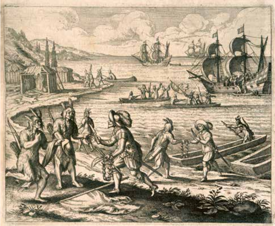
Der weltweite Handel erweiterte die Grenzen der bereisbaren Welt. Britische Kaufleute an der Küste Neufundlands, 1612.

endgültig ab – und galt dennoch als der »letzte Ritter«: In Turnieren, Bräuchen und Erzählungen lebte das Ritterideal fort. Bis heute hat das Wort »ritterlich« seinen edlen Nimbus bewahrt, doch für das Volk waren die brutalen Panzerreiter eine Plage – ein Produkt fehlender Staatlichkeit. Erst allmählich wurde wieder, teils unter arabischem Einfluss, eine Verwaltung aufgebaut, ein stehendes Heer fehlte. Von Kaisern und Königen verkündete Friedensgesetze wie der Reichslandfriede 1235 waren in den Wind gesprochen. Mit mäßigem Erfolg versuchte stattdessen die Kirche, die Fehden und Kleinkriege wenigstens von Donnerstag bis Sonntag und an den Feiertagen zu ächten ( treuga Dei ). Friedlich hingegen zogen nun fahrende Poeten durchs Land, mal als Vaganten beschimpft, mal als Minnesänger gefeiert, die in jenen Burgen von ihrer Vortragskunst recht und schlecht leben konnten (später als Meistersinger auch in den Städten). Bisweilen wurde in der Minnedichtung auch die ländliche Idylle nach Art der antiken amoenitas gefeiert.