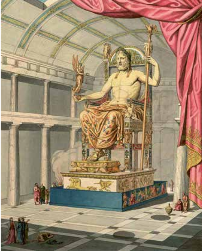
Neben den Pyramiden in Ägypten gehörte auch die Zeus-Statue im griechischen Olympia zu den »Weltwundern« und war ein beliebtes Reiseziel.

Dank der Ausrottung der Piraterie in der späten Republik konnten Fernreisen per Schiff unternommen werden, das war der schnellste und bequemste Weg. Reisen zu Lande waren aber häufiger. Dabei wurden menschenleere Berg- und Waldregionen möglichst gemieden: ein schrecklicher Durchgangsraum – locus terribilis . Besonders gefürchtet waren die Alpen, die Italien vom Rest des Reichs abschnitten. Den Gegenpol bildete der locus amoenus , das Angenehm-Liebliche. Hier ist die Hand des Menschen sichtbar – aber nicht dominant: die »arkadische« Hügellandschaft, das »bukolische« Hirtenidyll, als Refugium der Liebenden und der Denker, wie es von Theokrit und Vergil besungen wurde, das Ensemble aus Brunnen, Wiese und lichtem Hain, das schattige Flussufer.