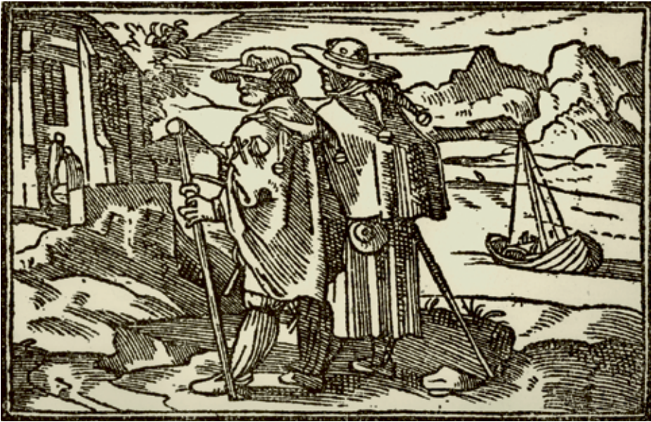
Mittelalterlicher Pilger und Pilgerinnen waren überall in Europa unterwegs zu Reliquien und heiligen Stätten.

chung war stets präsent. Frauen stellten rund ein Drittel der Pilgerschar, einige – auch Nonnen – besserten ihre Reisekasse mit »Hurengeld« auf, und mancher Wallfahrtsort war als Sündenbabel verschrien, voran Rom und Santiago mit ihren zahllosen Freudenhäusern und Badestuben.