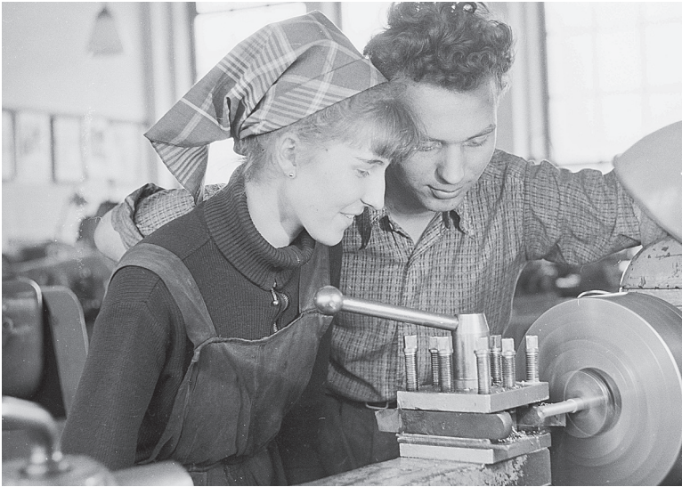
Sozialistisches Ideal der Emanzipation durch Berufsarbeit: Eine Facharbeiterin in einem Ost-Berliner Industriebetrieb, 1957.

drei andere politische Bereiche indirekt ab: die Bildungspolitik, die Sozialpolitik und die Frauenpolitik, die vor allem als Frauenarbeitspolitik konzipiert war. 14