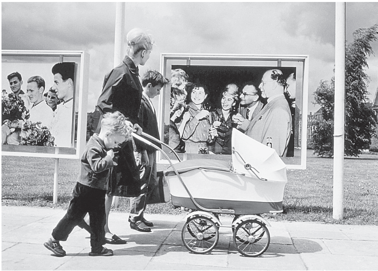
Familienalltag im Schatten der Politik: Eine Mutter in Ost-Berlin vor Fotowänden mit SED-Propaganda, 1964.

einstufen, mussten »moderne« ostdeutsche Frauen die drei Aufgabenbereiche Mutterschaft, Haushaltsführung und Berufsarbeit gleichzeitig bewältigen. Auch in der DDR wurden folglich Frau und Familie in der Regel zusammen gedacht. Die Vereinbarkeit der drei Felder stufte die SED als ein »spezifisches Frauenproblem« ein, und die politischen Debatten führten über das Familiengesetzbuch der 1960er Jahre bis zur SED-Familienpolitik der 1970er Jahre. 24