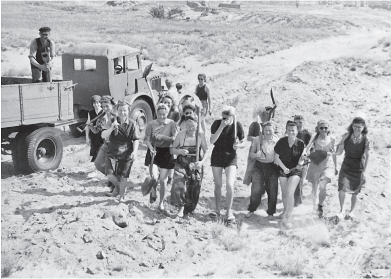
»Männermangel« nach dem Krieg: Freiwilliger Arbeitseinsatz von Frauen beim Bau des Flughafens Tegel in West-Berlin, Sommer 1948.

Verhalten auszusehen habe. Bis in die frühen 1960er Jahre zeigte sich das besonders deutlich, denn in dieser Zeit steckte die Politik in Ost- und Westdeutschland einen engen Handlungsspielraum ab.